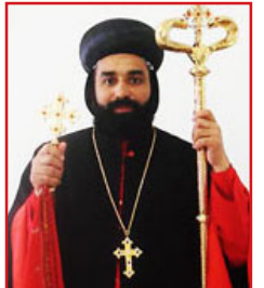
അയുബ് മോർ സിൽവാനോസ് മെത്രാപ്പോലീത്ത